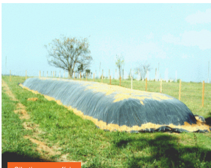
Silo tipo superfície.