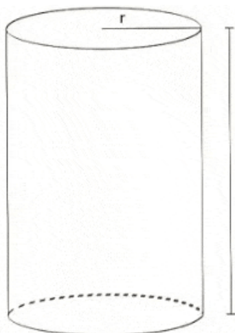
Dimensões do silo cilíndrico

Multiplicando-se o resultado do volume pela densidade de compactação, será obtido a quantidade de forragem a ser ensilada.