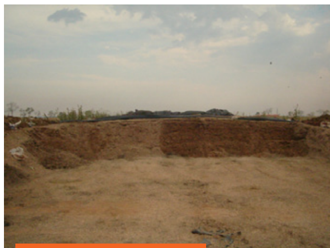
Silo Trincheira feito em alvenaria e silo trincheira feito de terra.