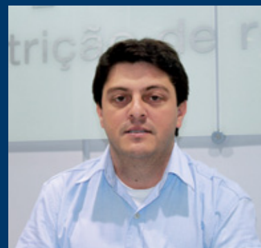
Escrito por Rafael R. Monteiro Consultor Técnico Premix PR/MS

Pode-se observar que com um planejamento e cálculos simples o produtor tem a capacidade de estimar a quantidade de volumoso conservado, que será utilizado durante o período seco e o tamanho do silo que será necessário, podendo optar pelo silo que mais se adequar a suas condições. ✖